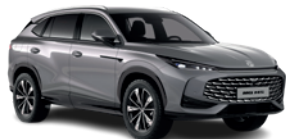
Szary „Hampstead Grey” (metalik)

Wybierz wariant wyposażenia: Excite, Exclusive, i przyciągaj spojrzenia, gdziekolwiek pojedziesz.