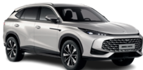
Srebrny „Sterling Silver” (metalik)