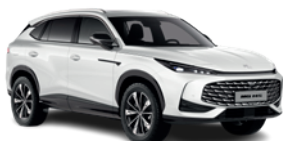
Biały „Pearl White” (perłowy)

* Lakiery trójwarstwowy, metaliczny i perłowy dostępne za dodatkową opłatą.