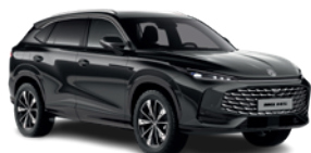
Czarny „Pebble Black” (metalik)