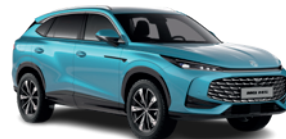
Niebieski „Arctic Blue” (standard)