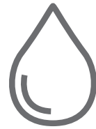
Zużycie paliwa 0,54 l/100 km