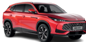
Czerwony „Diamond Red” (trójwarstwowy)