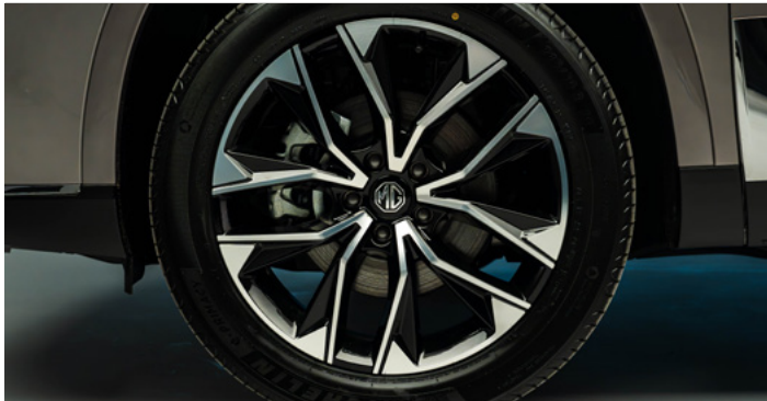
20" felgi aluminiowe