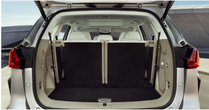
Pojemność bagażnika od podłogi do sufitu (3. rząd siedzeń podniesiony): 332 litrów