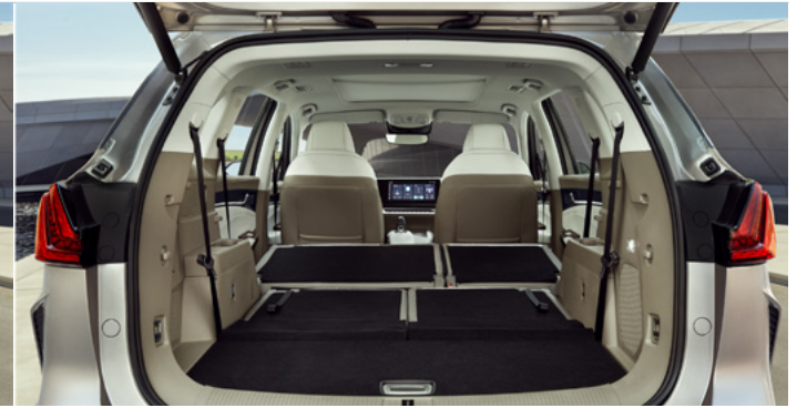
Pojemność bagażnika od podłogi do sufitu (2. i 3. rząd siedzeń złożony): 2 093 litry