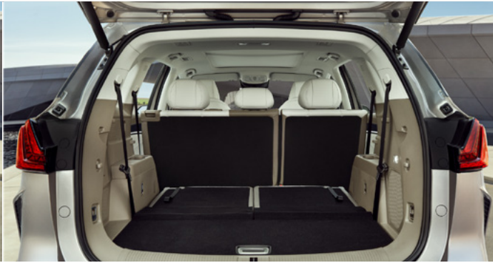
Pojemność bagażnika od podłogi do sufitu (3. rząd siedzeń złożony): 1 026 litrów