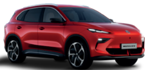
Czerwony „Diamond Red” (trójwarstwowy)

* Lakiery trójwarstwowy i metaliczny dostępne za dodatkową opłatą.