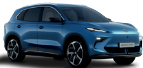
Niebieski „Arctic Blue” (metalik)

W MGS5 EV nie tylko poczujesz się dobrze, lecz także będziesz w nim dobrze wyglądać. Do wyboru sześć wyjątkowych, intrygujących kolorów. Przygotuj się na to, że będziesz przyciągać uwagę.