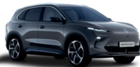
Szary „Hampstead Grey” (metalik)