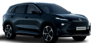
Czarny „Pebble Black” (metalik)