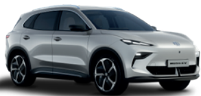
Srebrny „Cosmic Silver” (metalik)