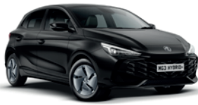
CZARNY „PEBBLE BLACK” (metalik)