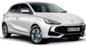
BIAŁY „DOVER WHITE” (standard)