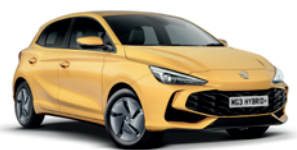
ŻÓŁTY „PASTEL YELLOW” (standard)

* Lakiery trójwarstwowe i metaliczny dostępne za dodatkową opłatą.