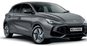
SZARY „HAMPSTEAD GREY” (metalik)