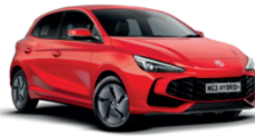
CZERWONY „DIAMOND RED” (trójwarstwowy)