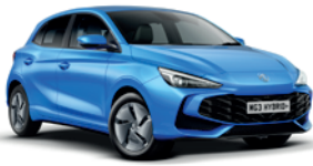
NIEBIESKI „COMO BLUE” (metalik)

MG3 nie tylko sprawi, że poczujesz się dobrze, ale także że będziesz dobrze w nim wyglądać dzięki możliwości wyboru spośród siedmiu wyjątkowych, intrygujących kolorów – z opcjami standardowymi, metalicznymi i trójwarstwowymi. Przygotuj się na to, że będziesz przyciągać uwagę.