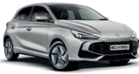
SREBRNY „COSMIC SILVER” (metalik)